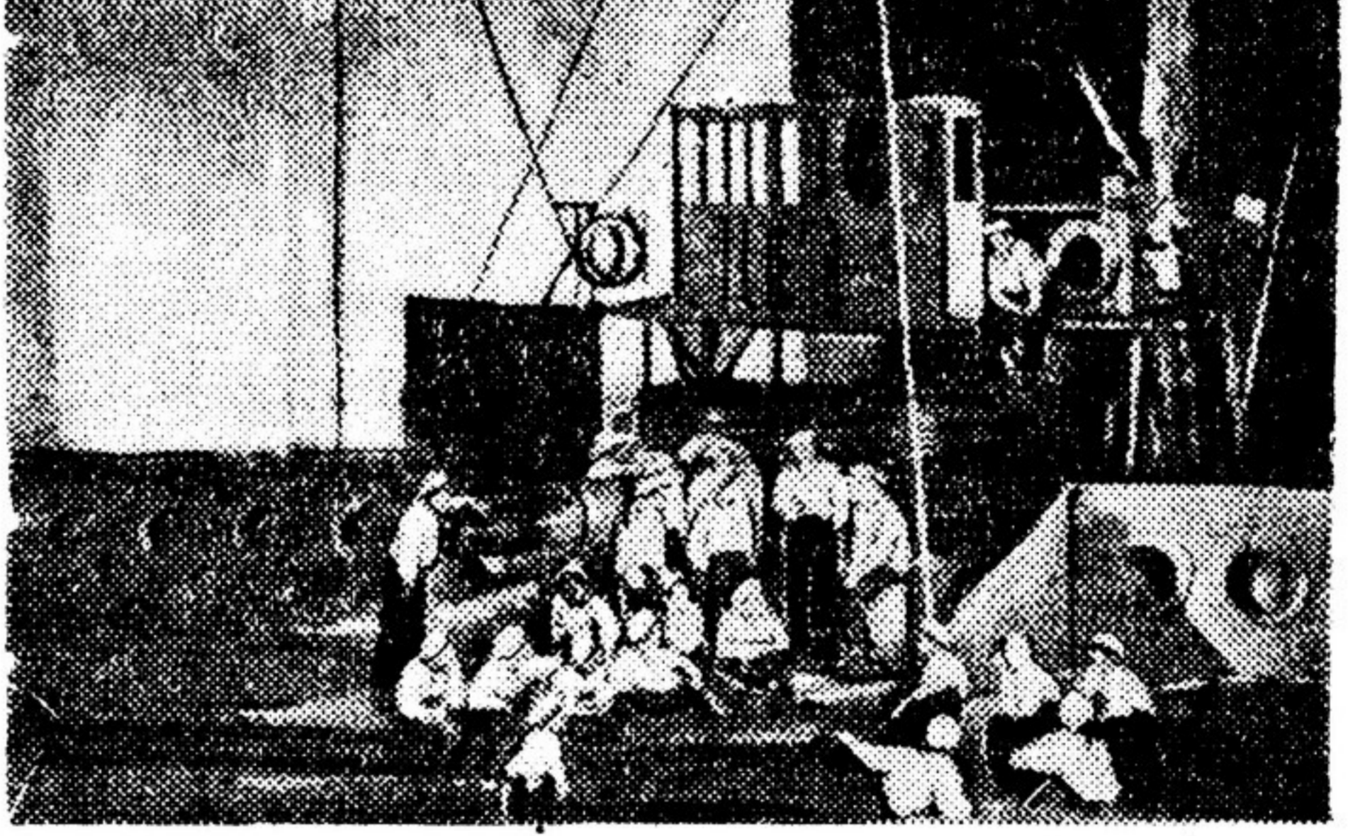
Сцена из «Разлома» (октябрь 1927 г.).

В процессе работы над спектаклем мы знакомим актеров с описаниями французского общества, мастерами сделанными замечательными романистами Бальзаком и Флобером. Произведения французских классиков помогли нам усилить социальную значимость спектакля. Сцена пьесы в Олимпии дана с особой резкостью в начале IV акта и с особой трагичностью в конце, чтобы показать отчетливее вину буржуазного общества за гибель Маргерит Готье, этой «девушки из народа», ставшей жертвой буржуа. Сцена в «салоне» Олимпии переключается с пиром в «Шагреневой коже» Бальзака. Мы вели даже новые персонажи игроков в карты (бразильские иностранцы старжики). Один мотив заимствован у Флора. Вседем в пьесу новый персонаж (мосье Кокардо) — читатель Флобера, шагающий читателя из флюберовского «Элеонара» прописавшегося к Кокардо, вышедшая буржуа, говорит от имени вообра-