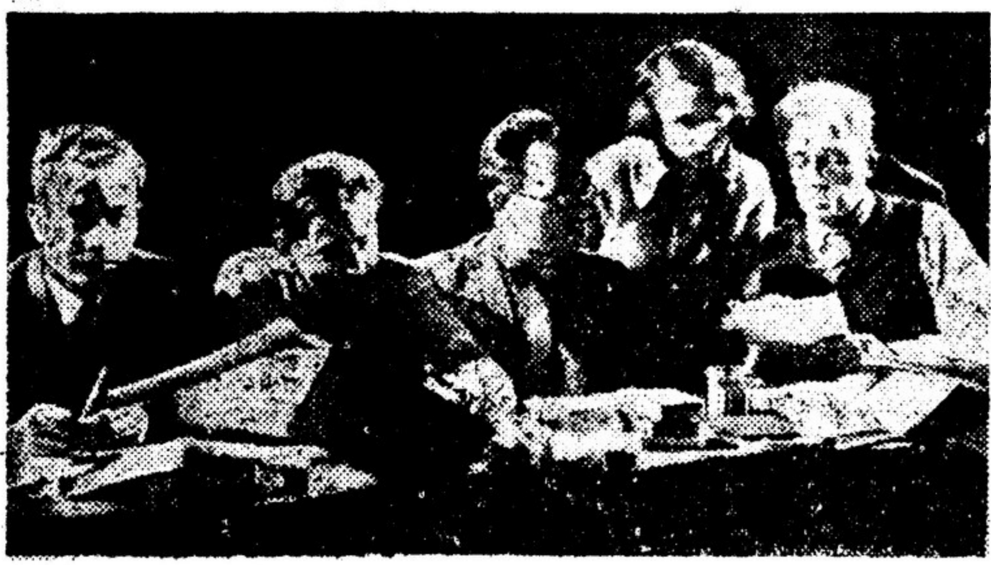
МАСТЕР ЗА РАБОТОЙ. Вс. Эм. Мейерхольд и члены режиссерской коллегии театра на постановочной репетиции «Дамы с камелиями».